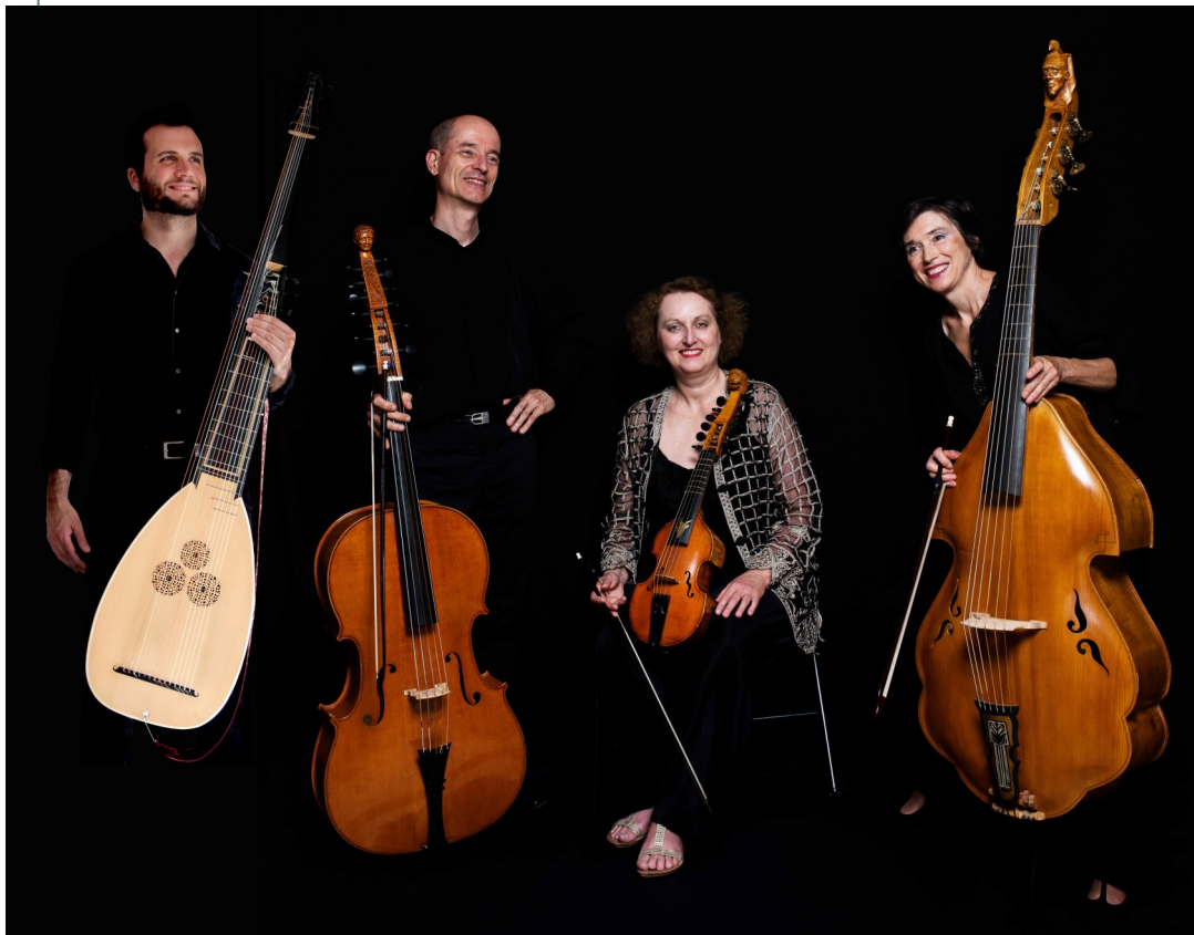
Le Concerto d'Amour

Grave - Allegro - Adagio - Thème et 24 variations