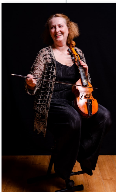
Pardessus de viole