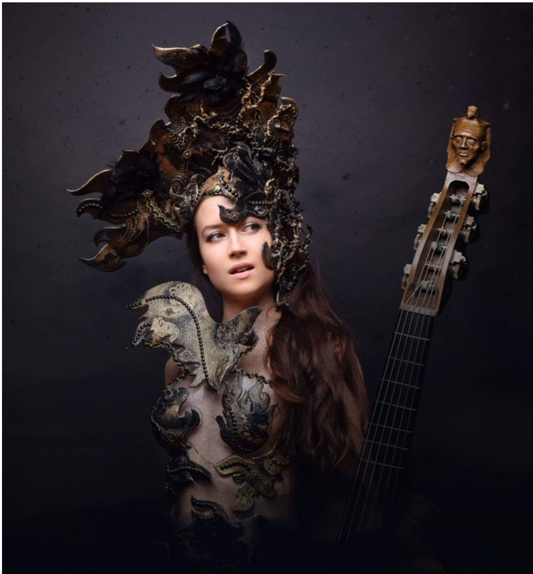
Atelier Fraise au Loup